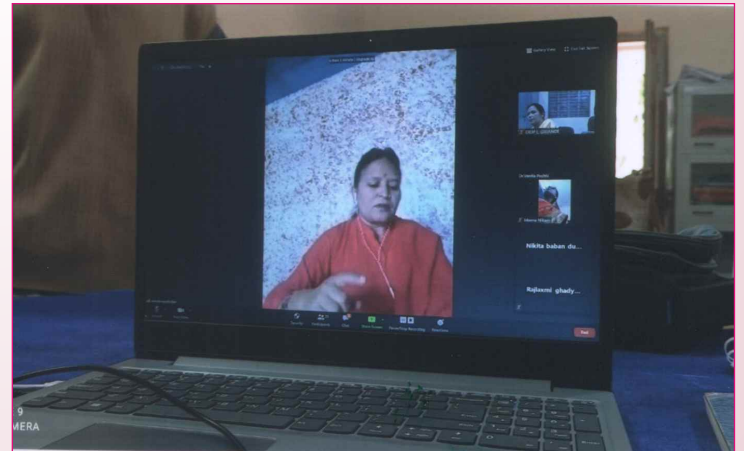
‘महिला सक्षमीकरणात ऐतिहासिक स्त्रियांचे योगदान’ विद्यापीठ स्तरीय कार्यशाळा