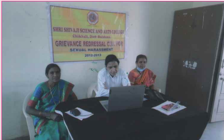
‘महिला संरक्षण व कायदे विषयक’ कार्यशाळा