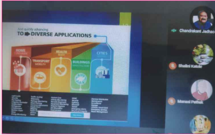
विद्यापीठ स्तरीय अभ्यासगत व्याख्यान