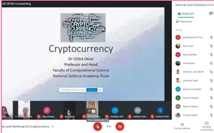
Cryptocurrency या विषयावर महाविद्यालयामध्ये Workshop आयोजित