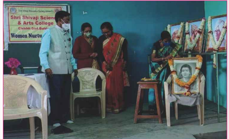
क्रांतीज्योती सावित्रीबाई फुले जयंती