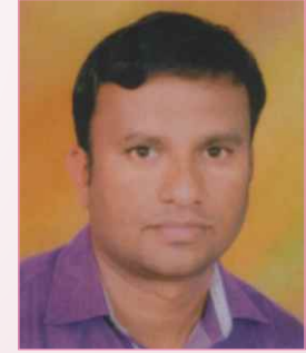
प्रा. ए. डी. मुघल सहसंपादक