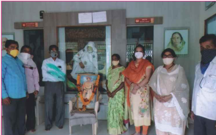
शाहु महाराज जयंती